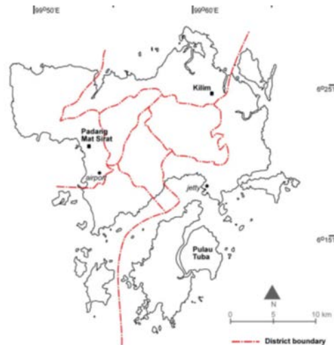
Rajah 1: Lokasi Kilim Geoforest Park di Langkawi.

Kajian ini adalah kajian kes berbentuk eksploratori yang dijalankan untuk meneroka dan memahami komponen nilai sepunya pelbagai pihak komuniti Kilim dalam lingkungan dan sempadan (konteks) yang tersendiri (Yin, 1999; Creswell, 2008). Lokasi kajian melibatkan salah sebuah kawasan pemuliharaan warisan utama di Langkawi iaitu Kilim Geoforest Park. Penubuhan Kilim sebagai geoforest adalah untuk mengimbangi keperluan pemuliharaan warisan geologi, biologi dan budaya, mengekalkan tradisi dan sosiobudaya setempat serta menjana ekonomi komuniti tempatan (Mohd Shafeea et al., 2007; Norzaini et al., 2010, 2011; Sharina, Hood dan Mustaffa, 2011). Pembangunan Kilim menyokong usaha pemuliharaan warisan dan pada masa yang sama membenarkan aktiviti pelancongan dijalankan (Mohd Shafeea et al., 2007). Sistem pengurusan pelancongan di Kilim ditadbir oleh komuniti tempatan dengan penubuhan Koperasi Pengurusan Ekosistem Perikanan yang berfungsi memantau segala aktiviti di sekitarnya. Rajah 1 menunjukkan lokasi Kilim di Langkawi Geopark.